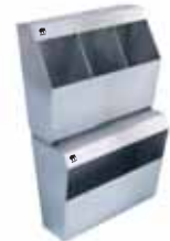
GAL 50 AK GALOŞ VERİCİ