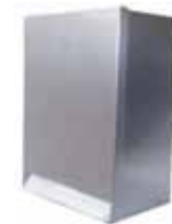
ONV102 ÖNLÜK VERİCİ